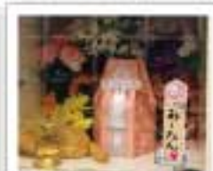
納骨堂用 1,100円 メモリアルボード