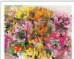
合同贈金時用 1,500円 花束