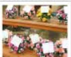
納骨堂用 2,400円 リース型アレンジ花