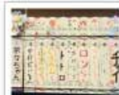
合同贈金時用 1,100円 メモリアルボード