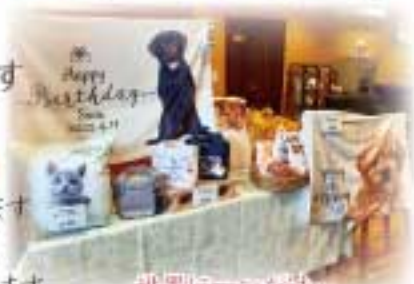
世界に一つだけの思い出を、いつもの場所に再び暖かさをもたせよう。

「思い出してあげる」こと…それが何よりのご供養です。あの子のメモリアルクッションは、再びあたたかい気持ちでお過ごしいただける日がくるまで、ご家族の心に寄り添ってくださいます。撥水性もよく、お洗濯で色移りや色あせの心配もありません。他にもブランケットやトートバックなどのサンプルもご用意しております。ぜひこの機会にお手に取ってご覧ください。