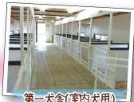
第一犬舎(室内犬用)