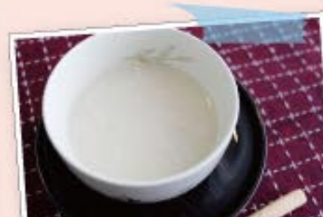
インアルコール甘酒