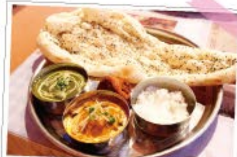
ゴマナンセット 1,090円

住所: 佐倉市栄町19-5京成サンコーポ佐倉1F TEL. 043-483-1854 駐車場: コインパーキング有 OPEN. (月~金) 11:00~15:00 17:00~22:30 (土・日) 11:00~22:30 定休日: なし