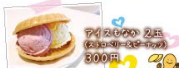
アイスもなか 2玉 (ストロベリー&ピーナッツ) 300円

今回のぶらり電車の旅は、京成本線のユーカリが丘～京成成田駅までの美味しいお店＆観光スポットをご紹介します★