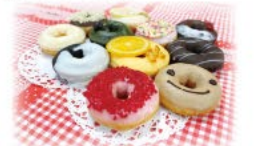
ツリーボックス 1箱 790円 2箱 1,500円 3箱 2,000円

ユーカリが丘駅とイオンさんを結ぶ連絡通路にある『ツリードーナツ』特に女性を中心に大人気で、その秘訣はカラフルで可愛い見た目と生地！店内に入るとショーケースの中に噂のドーナツが沢山☆可愛すぎて全種類欲しくなってしまうよ(笑)お店のドーナツは全て、ヨーグルトドーナツをベースに作られています。ヨーグルトとは、ヨーグルトから作った造語で、脱脂粉乳から作った自家製ヨーグルトを生地に一定の割合で混ぜ込んでいるそう。ヨーグルトは自家製することで市販品の10倍ほどの乳酸菌が宿るらしく、お腹の健康にも良いとのこと♪食べてみると、通常のドーナツと違ってしっとりもちもち！甘すぎないという事もあって、何個でも食べてしまいそうです…バラ売りもありますが、「ツリーボックス」もオススメ。人気のドーナツ6個入りのボックスが2種類あり、手土産として購入する方も多いです。しかも1箱買うと砂漠へ1本の苗木を植える支援を行っているとのこと。お店の名前もこのことからきているんですよ☆保存料や防腐剤は一切使っていないので、小さいお子さんにも安心。お店の半分はカフェスペースになっているので、店内で食べることもできますよ。