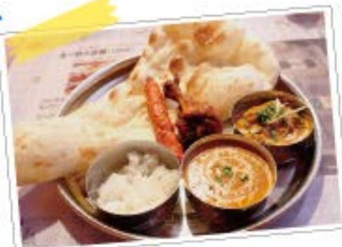
タンドーリセット 1,100円

京成佐倉駅から西へ少し歩くとカレーのスパイスのいい匂いが…佐倉店の他にも千葉寺店と、貝塚インターから少し離れた都町店があります。こちらのお店は、セットメニューでごはん＆ナンがつくので、両方味わってみたいけど食べきれないか心配という方にも安心♪カレーとタンドーリチキンも食べたい時は、タンドーリセットがオススメ。お好きなカレーを一覧から2種類選び、サラダ、タンドーリチキン、シークカバブ、ナン、ライス、ドリンクがついて、1,100円★ナンとライスはあかわり自由なので男性も満足できますよ。ちょっと変わったナンで、ゴマナンセットも食べてみて♪2種類のカレー(エビとほうれん草、ナスチキンカレー)、サラダ、チキンティッカ、ゴマナン、ライス、ドリンクがついて1,090円。ナンは細い方がもちもち、広がっている方がパリパリになっていて2つの食感が楽しめます。ゴマナンはゴマの香ばしさが絶妙で、普通のナンとは違った味が楽しめますよ。カレーはマイルド、普通、辛口、大辛、激辛の5種類。まろやか目なので、いつも食べるワンランク上の辛さを選ぶといいかも…?カレー以外にも、ネパール風焼きそばなどのメニューも豊富です。