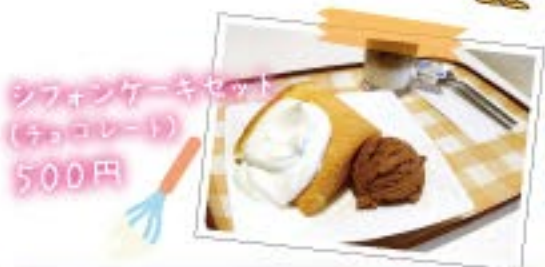
シフォンケーキセット (チョコレーリ) 500円

住所: 佐倉市染井野4-7-1 TEL. 043-463-5313 駐車場あり OPEN. 11:00~19:00 定休日: 火曜日