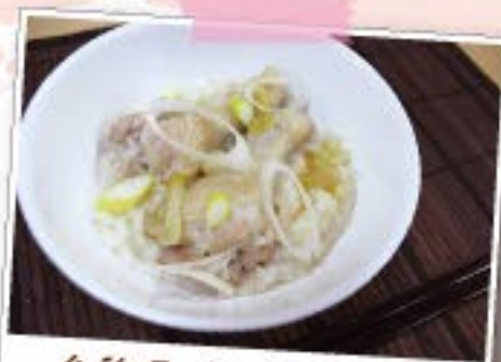
参鶏湯 (さむげたん)

少しお洒落な料理を作りたい!とは思っても、手間がかかるとなるといつもの料理に...でも炊飯器を使えばお洒落な料理や、いつもは時間がかかっていたあの料理も仕組みさえすればあとはセットしてスイッチを押すだけ!楽しくおいしい料理をつくっちゃおう★ ※IH炊飯器だと2度焼きがあまりされない物もあります。