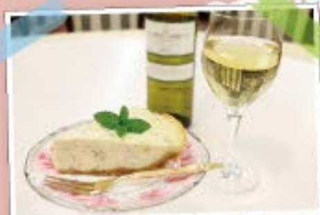
ブラックペッパーチーズケーキ