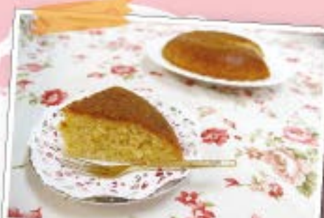
カステラ風蒸しパン