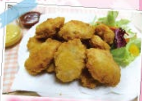
マック風チキンナゲット