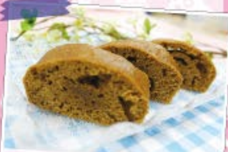
フクロク風黒糖蒸しパン