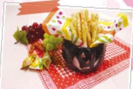
じゃがりこ風スナック