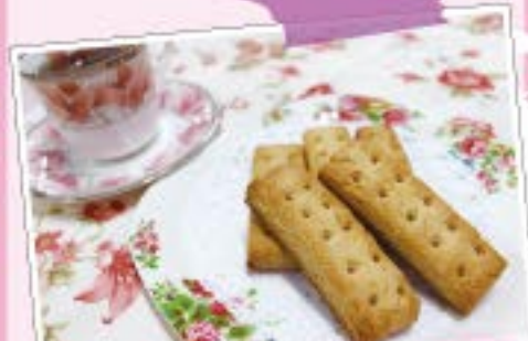
カロリーメイト(チーズ)風