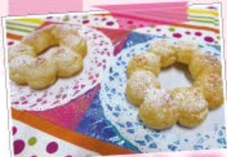
ボンデリング風ドーナツ