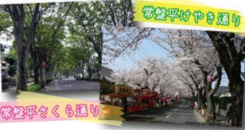
常盤平さくら通り

常盤平けやき通りは、読売新聞創刊120周年を記念した企画「新・日本街路樹百景」で全国から集まった470景の中から選ばれたものです。昭和36年に当時、田畑や林しかなかった常盤平に、大規模な常盤平団地が完成し、その中央を貫くメインストリートに沢山のケヤキが植えられました。雄大な樹形の美しさは見る人の心を和らげ、街並みに風格をもたらしています。