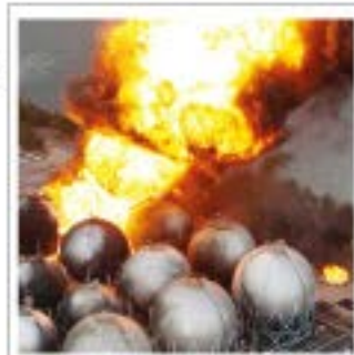
市原市コンビナート