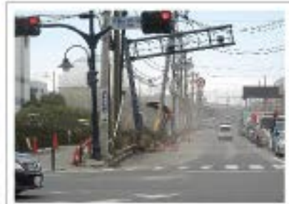
浦安市運動公園前交差点付近