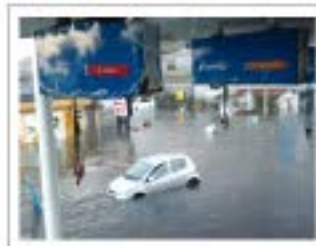
銚子市銚子港付近