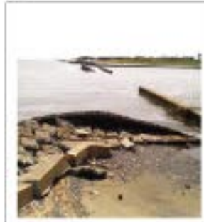
横芝光町屋形海岸付近