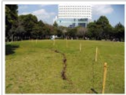
美浜区海浜幕張公園

被災地を紹介していい所をもっと知ってもらいたい…実際に行って、見ていただきたい！そんな気持ちから始まったこの企画も今回で5回目になりますが、最後にご紹介するのは千葉県です。千葉県では、最大で震度6弱を観測しました。さらに千葉市内でも震度5強を観測し、液状化現象や道路の陥没、コンビナートの爆発などかなりの被害が出ました。しかし、あの地震から一年半が過ぎ、地震の恐ろしさや不便だった日を決して忘れてはいけません。そこで、当時の被害状況や報道されなかった地域も含め、一部ですが振り返ってみたいと思います。