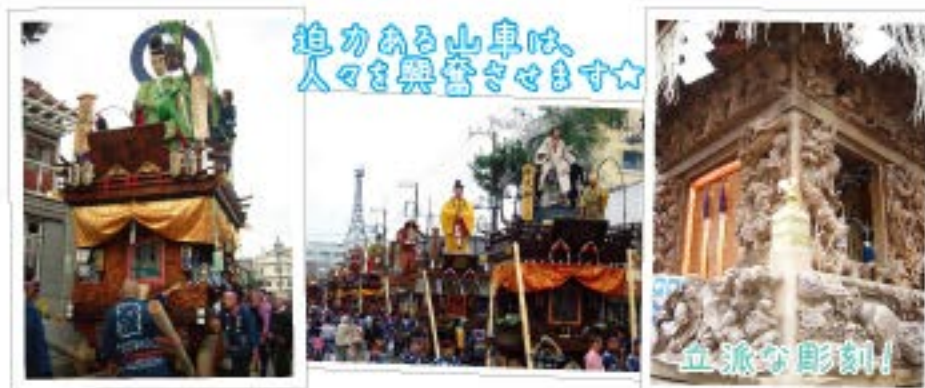
迫力ある山車は、人々を興奮させます☆

佐原の大祭は約300年の伝統を持ち、夏祭り(本宿祭り)と秋祭り(新宿まつり)に実施される関東三大山車祭りの一つです。佐原は市内を南北に流れる小野川によって、東側の地域と西側の地域とに区切られてます。東側の地域を本宿(ほんじゅく)、西側の地域を新宿(しんじゅく)と呼ばれています。このお祭りは国指定重要無形民俗文化財にも指定され、佐原囃子の音を町中に響かせながら、小江戸と呼ばれる町並みを進むさまは力強く風情たっぷりです。毎年多くの人々を興奮させます！自慢の山車は総檜(ケヤキ)造りの本体に、関東彫りの重厚な彫刻が飾り付けられます。上部には江戸・明治期の名人 人形師によって制作された、高さナント4mにも及び大人形などが乗り、さらに迫力満点です！