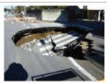
習志野市香澄公園付近