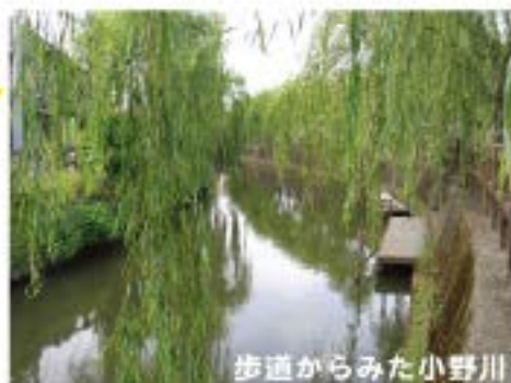
歩道からみた小野川