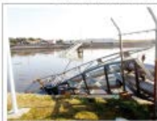
九十九里町片貝漁港付近