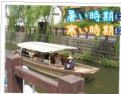
暑い時期はござで涼しく☆ 寒い時期はコタツで暖かい！

利根川に通じる小野川は、関東で初めて重要伝統的建造物群保存地区に指定されました。ゆったりと舟に乗り、柳越しに見る江戸風情が残る町並みは、歩いた時とはまた違った風情を感じることができます。佐原のまちは、小野川の舟運を軸として発展しており、川から見る佐原のまちこそ本物の商都・交易都市佐原の姿と言えます。そんな佐原の姿を、船頭さんがガイドとなって小野川や商都佐原の歴史等について解説してくれ、地元の人しか知らない"通"の情報などもこっそり教えてくれることもあります。