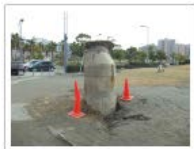
浦安市運動公園前交差点付近