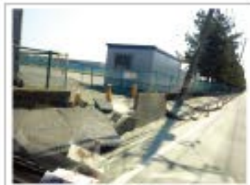
船橋市高瀬町付近